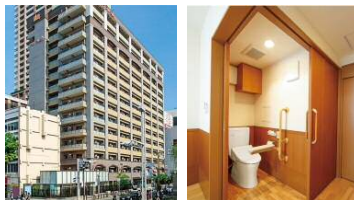
サービス付き高齢者向け住宅 ジョイフル名駅