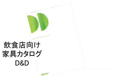
飲食店向け 家具カタログ D&D

FAX送付先 → 株式会社オリバー 高松営業所 087-863-3120 担当：五十嵐