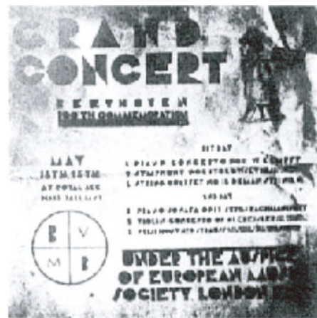
白井晟一卒業作品 1928-05

白井晟一氏は、50年代～80年代初頭まで活躍した建築家。松井田役場、雄勝町役場や日本芸術院賞を受賞した代表作「親和銀行佐世保本店」、東京都港区飯倉交差点に屹立するノアビル、松濤美術館などの設計を手がけた。その哲学的で独創的な設計と、難解な執筆から「孤高の建築家」と呼ばれる。また、山本有三の著書や自著も含む多数の装幀デザインを手掛け、特に1962年創刊時にデザインされた中公新書の見開きは今も使われている。白井晟一氏とは、どのような人物だったのか……孫・白井原多さんと京都工芸繊維大学名誉教授・竹内次男さんらによる、講演会&トークセッションで、素顔の白井晟一氏が語られます。