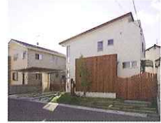
全体がよくわかる写真