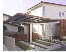
商品がはっきりわかる写真